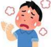
Yüzü sıcak basması Kas Gerilmesi