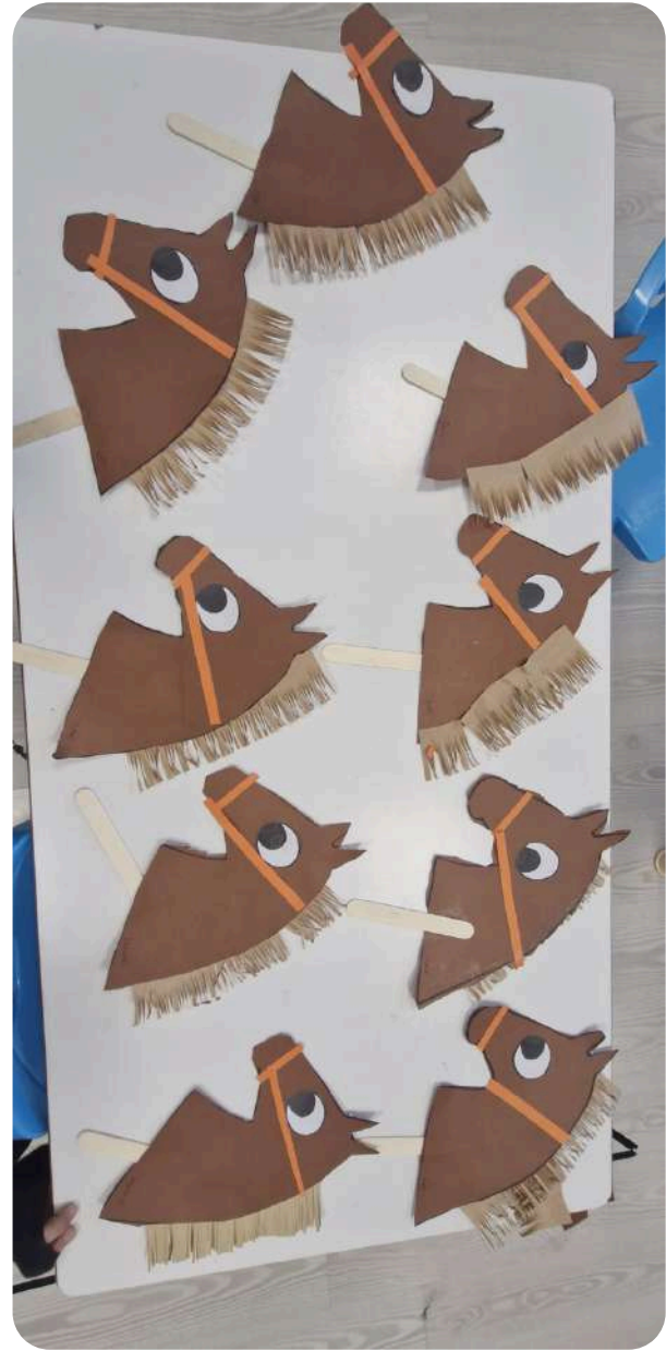
DOĞU ANADOLU BÖLGESİ